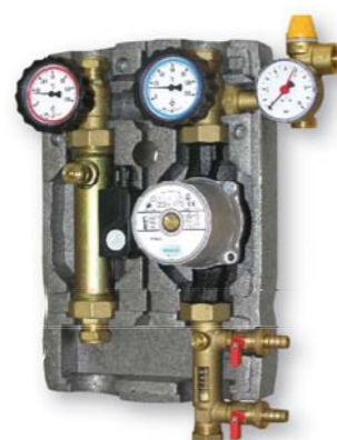
S2 Solar 3, 2-12л/мин.: G 3/4" M: код: 9909 S2 Solar 3, 8-28 л/мин.: G 1" M: код: 9050 S2 Solar 2, 20-70 л/мин.: G 6/4" M: код: 10570 S2 Solar 35, 2-12 л/мин.: G 3/4" M: код: 9911