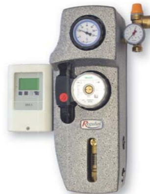
Регулятор SRS3, 2-12 л/мин. G 3/4" M: код: 10604 G 3/4" M: код: 10604

Термоизоляционный футляр из двух частей.