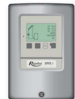
Регулятор SRS3, включая 3 датчика: код 9022

*только для измерения поставленного тепла