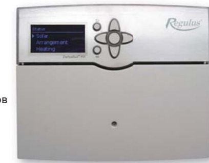
Регулятор DeltaSol MX: код 10560