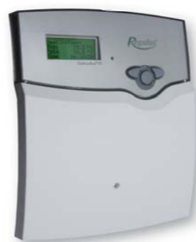
Регулятор DeltaSol M, включая 6 датчиков: код 7382