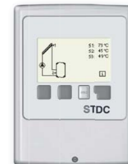
Регулятор STDC, включая 2 датчика: код 9159

PN 10. Макс. рабочая температура 120 °C (кратковременно 160 °C на 20 сек.)