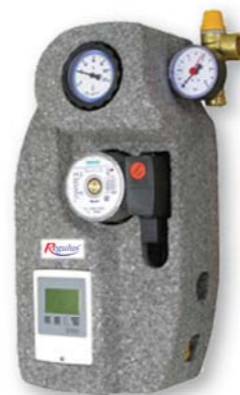
Регулятор STDC, 2-12 л/мин. G 3/4" M: код: 8910