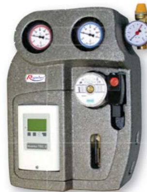
S2 Solar 3, Регулятор SRS3, 2-12 л/мин.: Cu 22 мм: код: 9226 S2 Solar 3, Регулятор SRS3, 2-12 л/мин.: G 3/4" M: код: 8911 S2 Solar 3, Регулятор SRS4, 2-40 л/мин.: G 1" M: код: 8912

Термоизоляционный футляр из двух частей. Специальная стальная задняя плита для быстрого и надежного закрепления на стенку или на соляной водонагреватель.